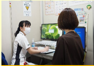
専門の保健師・看護師による 健康相談・アドバイスの実施